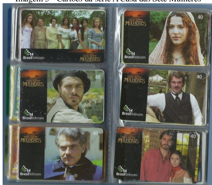
Imagem 5 - Cartões da série A Casa das Sete Mulheres

Considerando que A Casa das Sete Mulheres foi uma minissérie de televisão exibida em rede nacional e, mesmo com todos os preconceitos que ainda se observam em torno do trabalho historiográfico com fontes televisivas (NAPOLITANO, 2015), a minissérie em evidência pode tornar-se objeto de estudo do historiador. Uma das fontes para essa investigação pode ser os cartões telefônicos, que permitem refletir sobre os públicos que a programação atingia, sua circulação e recepção. Dessa forma, os cartões telefônicos podem ser tomados para construir parte da narrativa histórica, mostrando que, para além da tela da televisão, os personagens da teledramaturgia estavam presentes também nos telefones públicos. Para exemplificar, seguem os cartões encontrados dessa série.