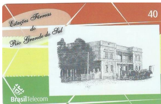
Imagem 1 - Cartão telefônico série Estações Férreas do Rio Grande do Sul (Frente)

Considerando os cartões telefônicos como fontes historiográficas, destaco que os mesmos são compostos de elementos escritos e visuais. Assim, embora a centralidade deste trabalho esteja na visualidade, é importante destacar que entendo os cartões a partir da articulação entre “pena e pincel” 5 . Para continuar a tessitura deste texto, proponho uma apresentação prévia da tipologia da fonte em estudo.