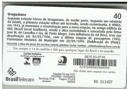
Imagem 2 - Cartão telefônico série Estações Férreas do Rio Grande do Sul (Verso)