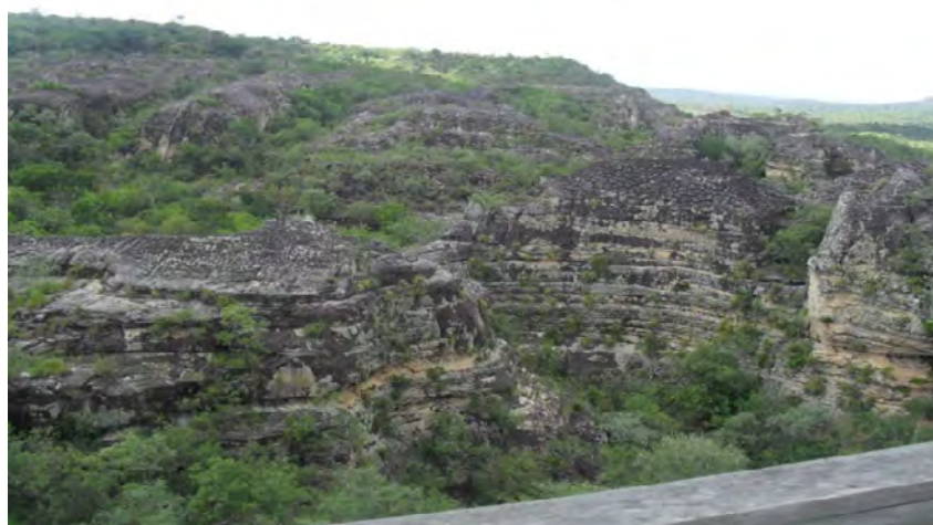
Figura 3 – Relevo Ruiforme do Parque Nacional Sete Cidades, Piauí

O relevo ruiforme (Figura 3) encontrado no Parque Nacional de Sete Cidades é resultado da erosão diferencial na rocha matriz, condicionado aos processos de intemperismo biológico, mecânico ou químico (GUERRA; GUERRA, 2008) sobre o material consolidado num ambiente com características de canais e de planície estuarina formada a partir de determinado tipo de erosão.