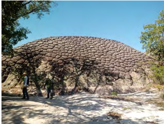
Figura 7 – “Pedra da Tartaruga”, Parque Nacional de Sete Cidades, Piauí

às juntas poligonais. Conforme destacam Guerra e Guerra (2008), “junta” é um termo que se usa também para designar fendas, fraturas ou diaclases. Pode-se observar que “a formação das feições poligonais é condicionada pelas fraturas, também conhecidas por juntas ou diaclases, que são fenômenos internos das rochas – ou seja, de caráter estrutural” (LOPES, 2011, p. 63).