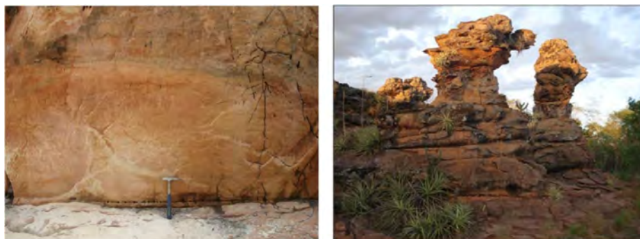
Figura 2 – Fotografias que representam os arenitos da Formação Cabeças

Os paredões de arenito avermelhados são constituídos por uma areia quartzosa fina, que modelados por meio do intemperismo físico e químico dão traços marcantes à “cidade encantada”, com partes do relevo ruiforme cobertos por limonita e “folhas de ferrificação” permitindo uma livre interpretação das geoformas no imaginário dos visitantes sobre os arenitos deltaicos da formação Cabeças (Figura 2) (SANTOS, 2001).