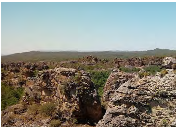
Figura 6 – “Mirante das Cidades”, Parque Nacional de Sete Cidades, Piauí

O ponto de observação da Geodiversidade seguinte compreendeu o “Mirante das Cidades” (Figura 6). Localizado nas coordenadas 04°05’44,83” de latitude Sul e 41°41’48,24” de longitude Oeste, o Mirante possui uma vista panorâmica de boa parte do Parque de Sete Cidades, onde se pode observar parcialmente o conjunto das denominadas “Sete Cidades”. Quanto ao potencial didático proporcionado na paisagem desse ponto, pode-se discutir as formas de relevo residual do tipo ruiforme, formados a partir dos processos erosivos sobre os arenitos da Formação Cabeças, apresentando assim um aspecto de ruínas.