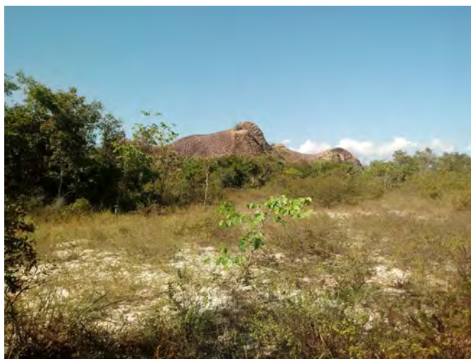
Figura 8 – Geoforma “Pedra do Elefante”, Parque Nacional de Sete Cidades, Piauí

Apresentando uma beleza cênica e relevante valor científico, a “Pedra do Elefante” (Figura 8) foi outro ponto com importante geodiversidade que pode ser trabalhado em atividade de campo. Localizada na sexta cidade, nas coordenadas 4^{\circ}5'53,89'' de latitude Sul e 41^{\circ}41'45,12'' de longitude Oeste, a “Pedra do Elefante” consiste em uma macroforma que apresenta uma superfície coberta por estruturas poligonais, semelhante a geoforma da “Tartaruga”, com duas feições principais (BARROS et al. , 2011). Fortes (1996) aponta que as superfícies poligonais compreendem feições geomorfológicas de origem físico-químicas desenvolvidas sob os arenitos transportados por canais fluviais, em superfícies de estratificação cruzada.