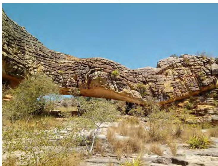
Figura 5 – Geoforma “Biblioteca”, Parque Nacional de Sete Cidades, Piauí.

O segundo ponto de análise consistiu em uma geoforma ruiforme localiza-se às coordenadas 04°05'44,83” de latitude Sul e 41°41'48,24” de longitude Oeste. Denominada “Biblioteca” (Figura 5), essa feição de relevo apresenta características de canais e de planície estuarina. Barros, Ferreira e Pedreira (2011), destacam que em sua constituição existem “salões” erodidos entre dois canais, separados por uma sequência de arenitos finos e siltitos com estratificações plano-paralelas, que consistem em depósitos da planície estuarina à época da formação da Bacia Sedimentar do Parnaíba.