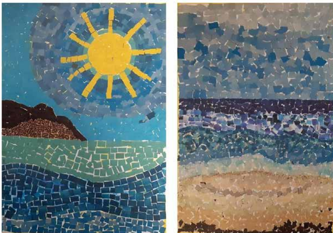
Figura 5 – Mosaico produzido pelos estudantes do 8º ano para o caderno turístico-educativo.

Posteriormente a pesquisa de campo, os/as estudantes, sob orientação de residentes e professores, se organizaram em dois grupos para a realização de atividades acerca do estudo do meio. As equipes sintetizaram vivências, experiências e poéticas de campo e as inter-relacionaram com seus saberes de vida e conteúdos estudados no ambiente escolar. Após as reflexões coletivas, cada formação concebeu um caderno turístico-educacional (Figura 5).