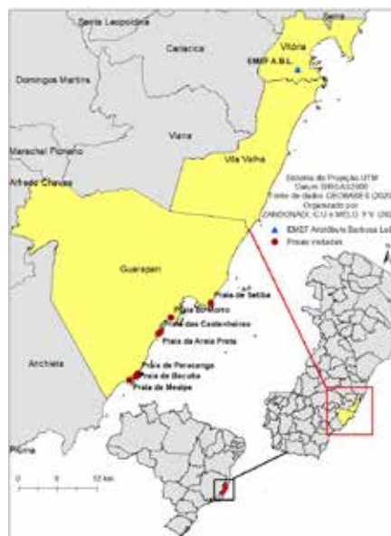
Figura 1 – Mapa de localização das praias visitadas