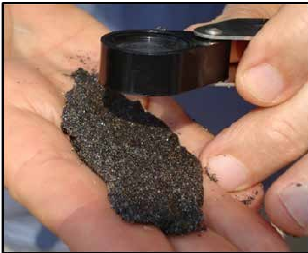
Figura 3 - Análise mineralógica das areias monazíticas da Praia da Areia Preta, Guarapari, ES

Para finalizarmos este ponto, pesquisamos na prática os minerais componentes da popular areia escura desta praia, discutindo coletivamente acerca da exuberância da natureza. Os/as estudantes puderam tatear os grãos minerais, percebendo suas diferentes colorações, texturas e tamanhos, propriedades associadas às características específicas de cada mineral (Figura 3). Assim, os/as estudantes fizeram observações importantes acerca de três dos principais minerais do depósito sedimentar: o quartzo, a magnetita e a monazita. Nas palavras dos/das estudantes (Estudantes 20 e 21): “o quartzo tem uma cor bem clara e tem muitos grãos”, “a magnetita é bastante curiosa, pois ela parece um imã”; “a monazita é o mais bonito dos minerais, ela tem uma cor bem forte”.