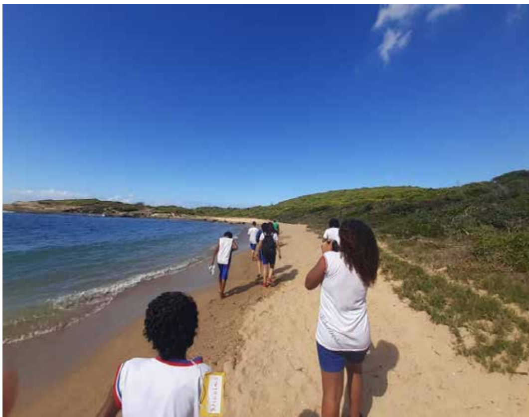
Figura 2 - Estudantes cartografando paisagens na trilha do Morro da Pescaria, Guarapari, ES