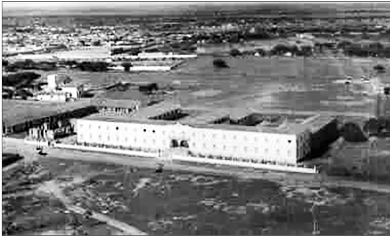
Figura 1 – Prédio do CDSL (1956)