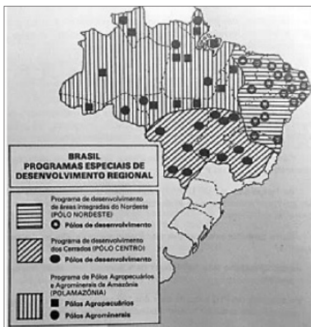
Figura 1 – Programas de Desenvolvimento.