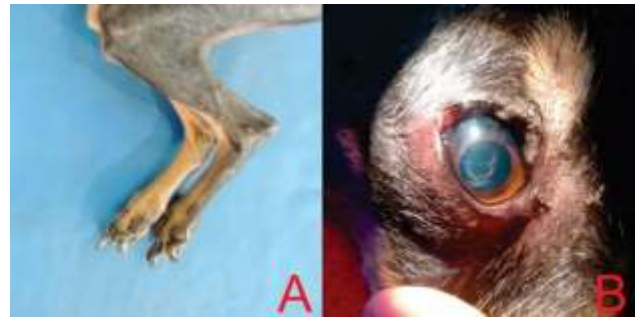
Figura 01. Sinais clínicos presentes na avaliação física do cão. (A) Onicogribose nos membros pélvicos. (B) Opacidade na cápsula anterior do cristalino, blefarite e discreta secreção mucoide no olho direito de um cão portador de Leishmaniose atendido no Hospital Veterinário da Universidade Federal de Campina Grande.

Diante do quadro clínico, suspeitou-se de dermatofitose, leishmaniose e doença cardíaca valvar, sendo neste momento solicitado hemograma, proteínas plasmáticas totais (PPT), pesquisa de hematozoários, do-