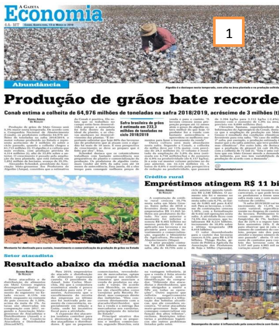
Figura 1 – Publicação da edição de 13/05/2019/ Figura 2 – Publicação da edição de 17/03/2019.

Segundo a Companhia Nacional de Abastecimento (CONAB), houve um acréscimo de três milhões de toneladas a mais que no ciclo anterior e, ainda, que os produtores colherão o maior volume já produzido no Estado. O cultivo de algodão é tratado como a cultura evolutiva de grão exportador (Figura 1). Consta no texto que a expansão do Produto Interno Bruto (PIB) do Estado foi de 2,5% no ano de 2018, acima da média regional de 0,1% e como o 6º melhor Estado do país em desempenho de exportação. As informações significam que a exportação de soja de Mato Grosso tem destino certo, sua transação comercial firmada com a China, o maior consumidor de soja do planeta. Alguns municípios, onde o agronegócio prospera, apresentam um Índice de Desenvolvimento Humano (IDH) mais alto, com renda per capita maior; porém, o jornal divulga que a maioria dos municípios mato-grossenses não vivencia essa realidade, devido à distribuição desigual de renda no Estado (Figura 2).