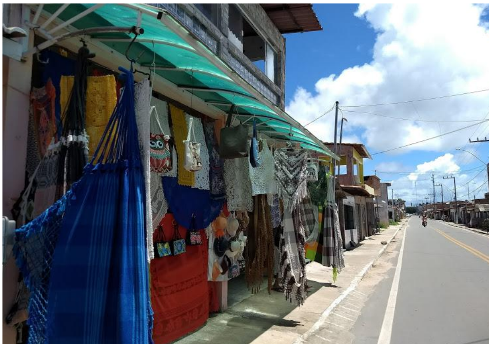
Figura 3: Lojas de Renda.

No que diz respeito às mulheres rendeiras de Raposa que ainda se mantém nesse ramo, percebeu-se um profundo conhecimento da atividade que desempenham e que, também, possuem laços com o estado do Ceará. Esse ramo de atividade é um fator de atração de turistas, que ali sentem, experimentam e visualizam as produções feitas pelas rendeiras, ilustrada na Figura 3, abaixo.