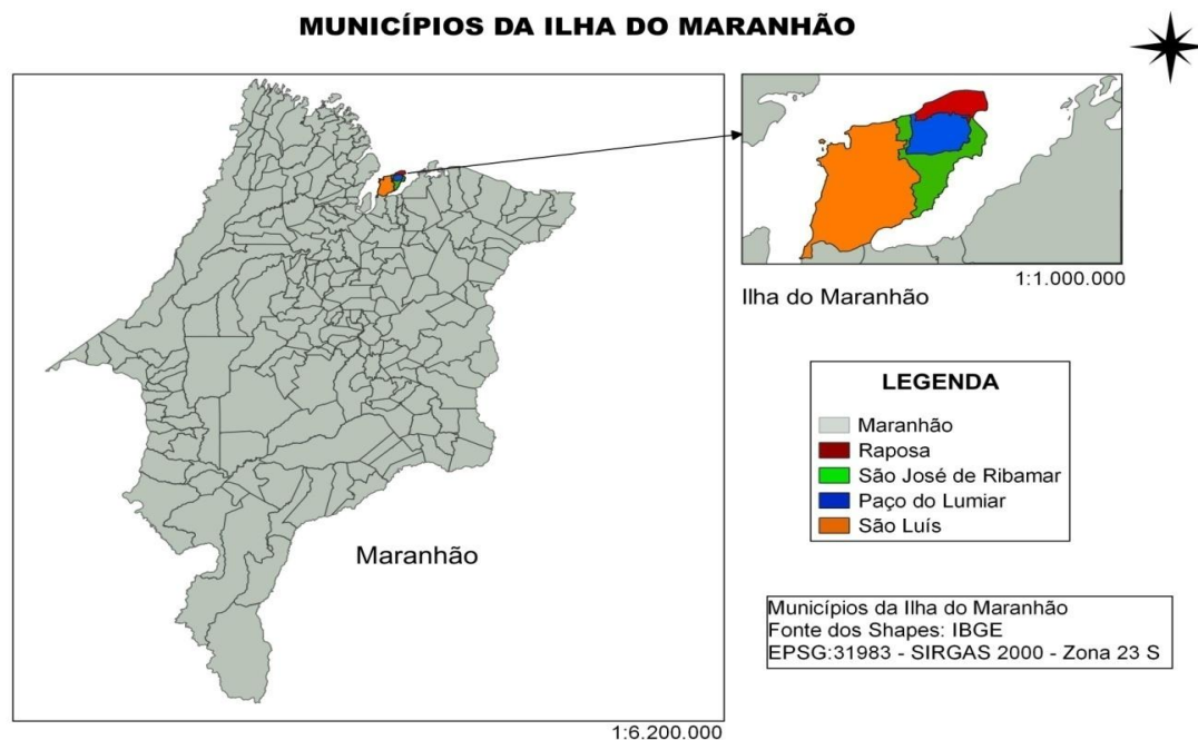
Figura 1- Ilha do Maranhão.

O município de Raposa, distante cerca de 28 km do Centro de São Luís, situa-se na porção norte da Ilha do Maranhão. De acordo com dados do Instituto Brasileiro de Geografia e Estatística - IBGE (2019), Raposa possuía, àquele ano, 30.761 habitantes. Na referida Ilha, ainda se localizam os municípios de Paço do Lumiar, São José de Ribamar e a capital, São Luís, ilustrado na Figura 1 abaixo. Raposa é um destino bastante frequentado pelos moradores da Ilha, que o buscam principalmente aos fins de semana e feriados, seja para lazer praiano, gastronômico ou de consumo.