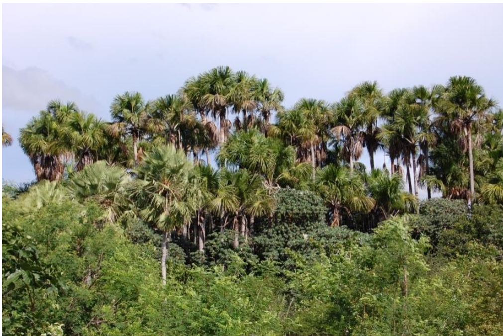
Figura 3: Buritizal na região da APA do Delta do Parnaíba (Buriti dos Lopes, PI). Foto: F. S. Santos-Filho (abr. 2011).

Os buritizais (Figura 3), a exemplo do que ocorre em regiões de Cerrado Central em Goiás e Minas Gerais, acompanham cursos d'água, formando as veredas caracterizadas como feições bem típicas dos Cerrados (ROMARIZ, 1996; RIBEIRO & WALTER, 2008), presentes também em território do Piauí.