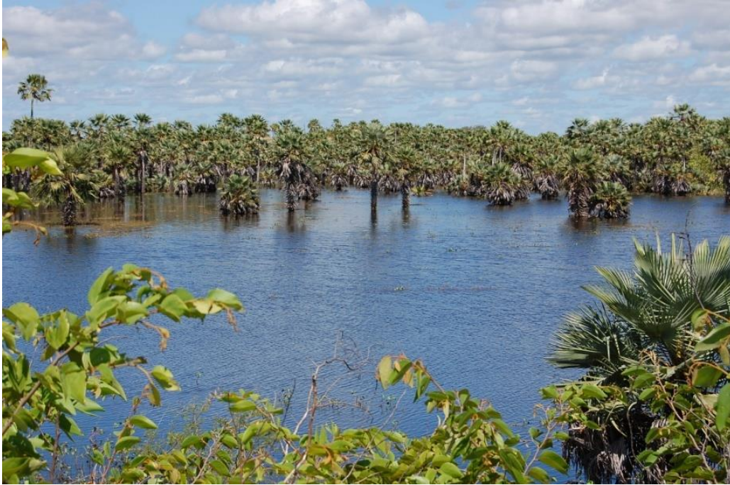
Figura 2: Carnaubal na região litorânea do Piauí (Luiz Correia, PI). Foto: F. S. Santos-Filho (abril/2011).

Os buritizais (Figura 3), a exemplo do que ocorre em regiões de Cerrado Central em Goiás e Minas Gerais, acompanham cursos d'água, formando as veredas caracterizadas como feições bem típicas dos Cerrados (ROMARIZ, 1996; RIBEIRO & WALTER, 2008), presentes também em território do Piauí.