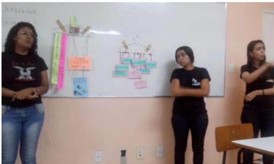
Figura 3 – Alunos e interpretes no momento do Seminário no Cabide.