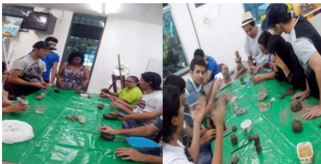
Figura 1 - Trabalho com argila. Tema Identidade.

Para Ciampa (2001) a construção da identidade associa-se a relação do individual com o plural, ou seja, no coletivo que habita cada pessoa. Para o autor, identidade é um metamorfosear-se a cada encontro, o que perpassa pela transformação pessoal do humano. Portanto, a identidade é de cada humano, aquilo que se define no agora, suas experiências anteriores e projeções. Na ideia de compreender este sentido de identidade, com a parceria dos alunos do curso de Artes, os discentes de Psicologia da educação foram apresentados as técnicas básicas da modelagem de argila. O objetivo consistiu em que representássemos na argila elementos que reportassem a própria identidade (Figura 1).