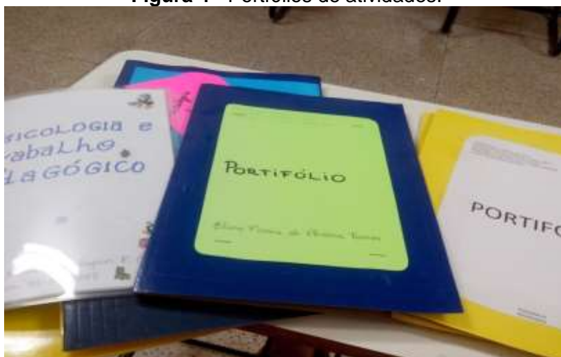
Figura 4 - Portfólios de atividades.

(notas pessoais, experiências de aula, trabalhos pontuais, controle de aprendizagem, conexões com outros temas fora da sala de aula, representações visuais, etc.) que proporciona evidências do conhecimento que foi construído, das estratégias utilizadas e da compreensão dos temas de quem elaborou.