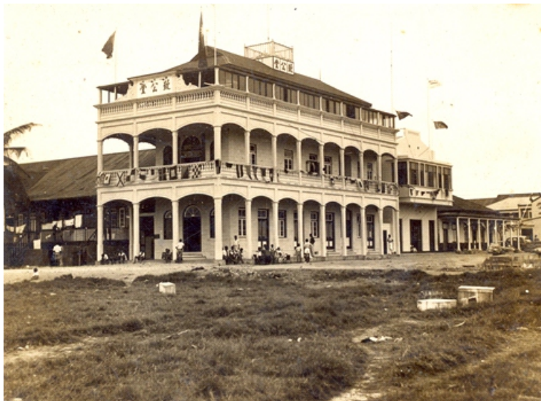
IMAGEM 1: Edifício do Chee Kung Tong (conhecido como “Clube Chinês”) na Beira, Moçambique, onde se iniciaram as primeiras atividades associativas da comunidade chinesa

Em 1943, o Chee Kung Tong Club (Clube Chinês) solicitou à Comissão Administrativa da Câmara Municipal da Beira a autorização para fazer uso de dois terrenos situados nas suas adjacências, com o objetivo de criar um espaço para a prática de “exercícios físicos e desporto” 6 . A autorização, ainda que em caráter temporário, foi concedida. Nessa época, o Chee Kung Tong Club já era considerado uma instituição de “beneficência, recreio, educação e instrução da comunidade chinesa” residente na Beira. Em 1944, a partir de uma licitação pública, a instituição consegue os terrenos de forma definitiva. Ali se construiria, no início dos anos 50, a Escola Chinesa e uma quadra de basquete 7 . Portanto, do núcleo inicial conformado pelo Chee Kung Tong Club surgiram, em virtude da aquisição desses novos terrenos, outras duas instituições igualmente importantes: a Escola Chinesa e o Clube Atlético Chinês (Tung Hua Athletic Club).