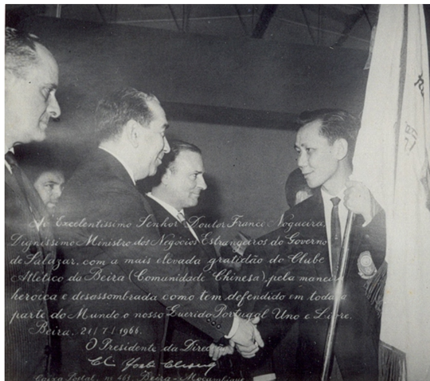
IMAGEM 7: RITUAIS DE PORTUGALIZAÇÃO [2] Nesta imagem, um dirigente do Atlético Chinês (com a bandeira do Clube) presta reconhecimento ao Ministro dos Negócios Estrangeiros de Portugal, Franco Nogueira, em visita à Beira, em julho de 1966. A foto foi impressa com um texto no qual se lê: “Ao Excelentíssimo Senhor Doutor Franco Nogueira, Digníssimo Ministro dos Negócios Estrangeiros do Governo de Salazar, com a mais elevada gratidão do Clube Atlético da Beira (Comunidade Chinesa), pela maneira heróica e desassombrada como tem defendido em toda a parte do Mundo o nosso Querido Portugal Uno e Livre.” Beira, 21/7/1966. O Presidente da Direcção C. F. F. C. S.