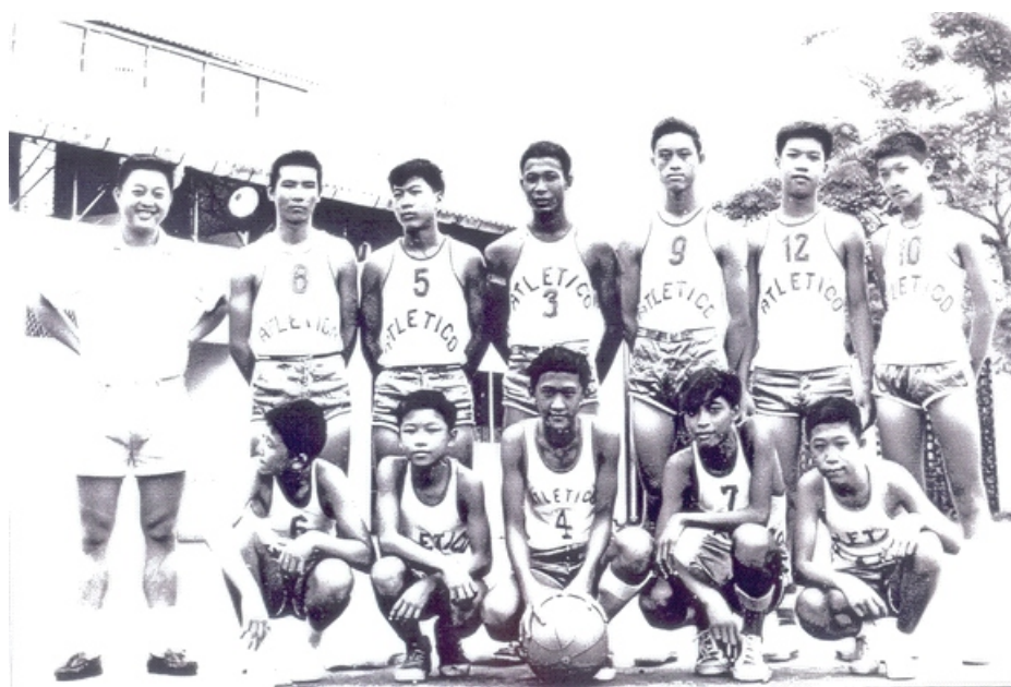
IMAGEM 9: Os jovens do Atlético Chinês antes da diáspora. Dos que aparecem nesta fotografia, apenas um ficara em Moçambique. A imagem é de 1962 e foi tirada no Clube Esportivo da Beira:

Com as mudanças do período pós-colonial, mudou também o estatuto dos chineses beirenses. A independência de Moçambique e o fim da ditadura em Portugal trouxeram novos porta-vozes a um cenário já repleto de sentimentos de desconfiança e apreensão em relação aos outrora “bons portugueses”. Tais sentimentos obedeceram, em parte, às novas circunstâncias nascidas da derrota militar e política de Portugal no Ultramar; ou seja, tratava-se de um momento em que a própria substância que alimentava a ideia de nação se encontrava em plena mudança e precisava, urgentemente, recompor-se a partir de novas bases identitárias e políticas. Portugal atravessava, portanto, o momento limiar no qual devia abandonar os desígnios de sua vocação Imperial e começava a enxergar os desafios do seu iminente futuro europeu. Como portadores de uma cidadania ambígua, os chineses beirenses tiveram, também, que reinventar sua condição de (ex)portugueses nascidos em Moçambique. Entretanto, as memórias em torno do Atlético Chinês bem como as fotografias de família que evocam seu passado esportivo constituem, para eles, uma fonte densa e significativa na produção e a reprodução dessa reinvenção identitária.