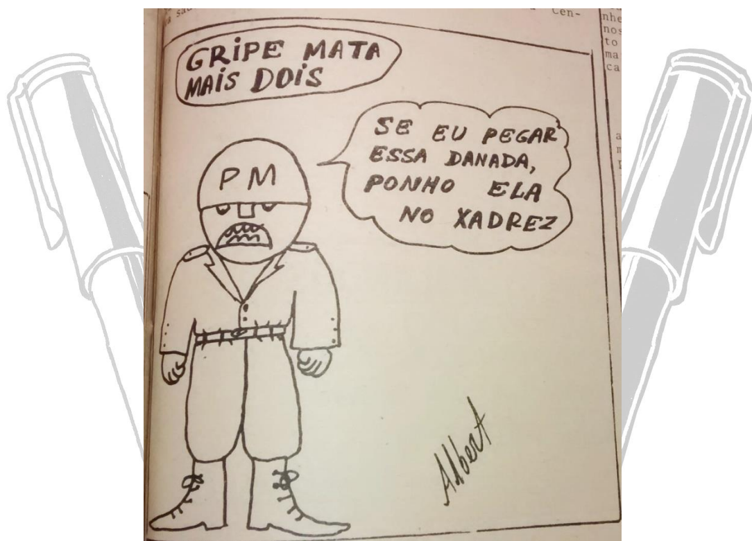
Imagem 2- Charge produzida por Albert Piauhy encontrada no Jornal O Estado , Página 9 – sábado – 10/02/1973.

Ou seja, os intelectuais que iriam se tornar os chargistas representantes do movimento contrários ao regime beberam, se influenciaram da produção desses outros chargistas e cartunistas nesses jornais alternativos.