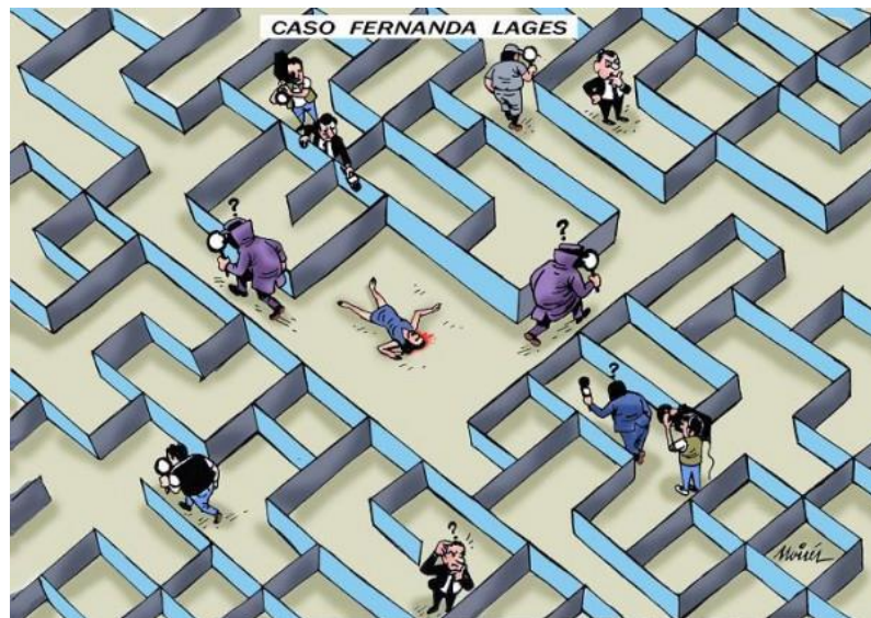
Charge 1: Caso Fernanda Lages 2